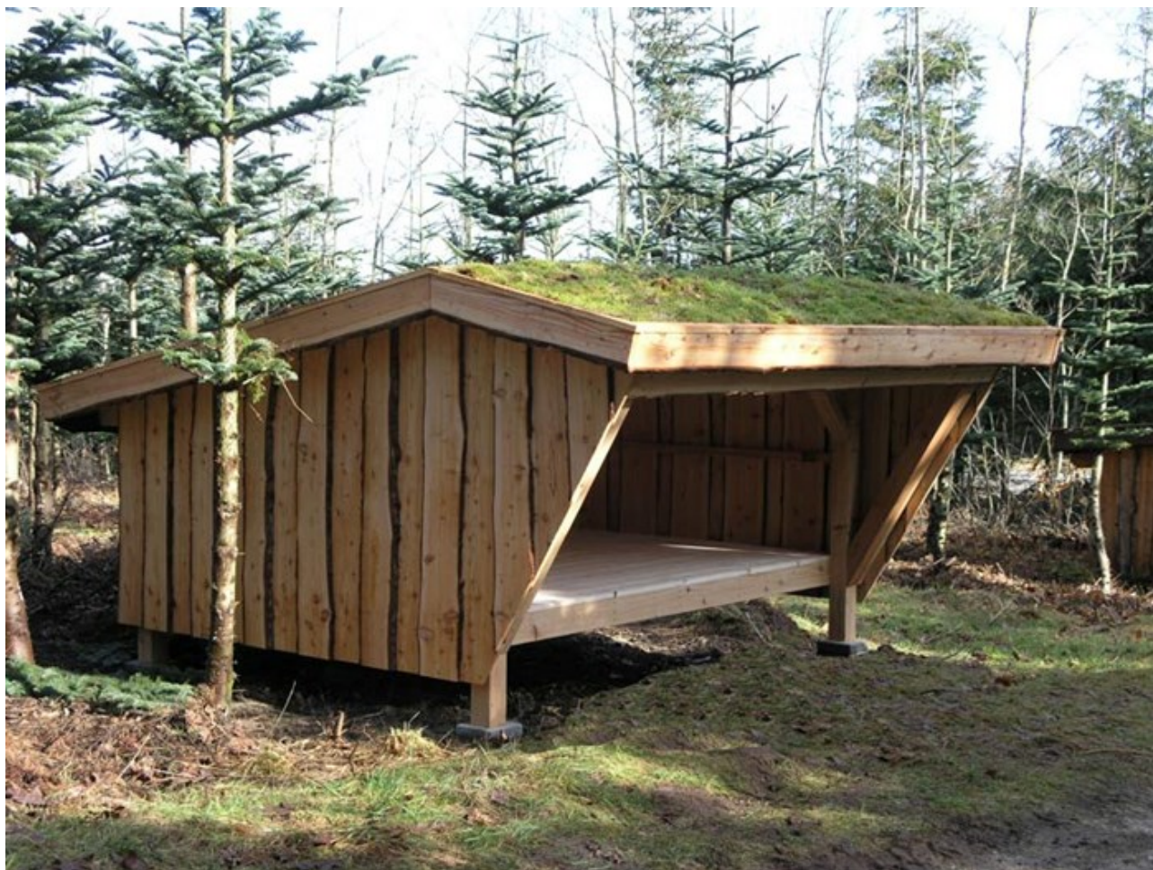
Foto af færdigt opsat shelter

Det mest regulære shelter, og billigste i pris efter søgning på nettet, er fra shelterbyg.dk. Det er et 5 persons shelter. Prisen er 13.125 med moms og 10.500 uden moms. Uden levering