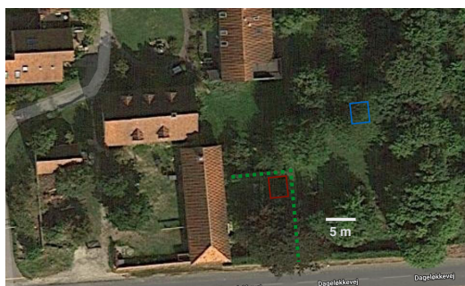
Placering af Gårdens haveskur

Vi vil gerne have et skur på omkring 9 kvm. Det kræver ingen byggetilladelse at opføre et haveskur så længe det er under 10 kvm. Vi ønsker at opføre et skur i træ og har fundet nogle bud på hvordan et sådan træskur kunne se ud (se venligst næste side).