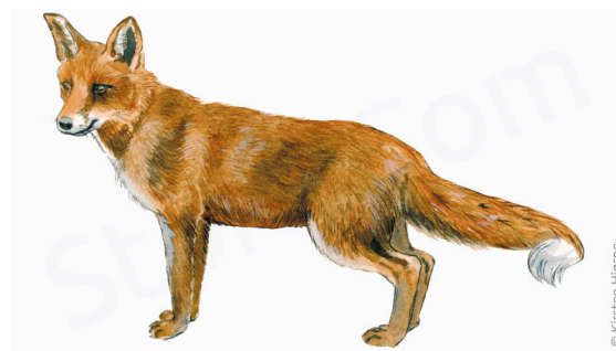
Ræv - Vulpes vulpes - Red fox

Ræven føder sine 4 - 8 hvalpe i rævegraven. De vejer kun 100 gram, når de bliver født. Først om 4 uger begynder de at lege udenfor rævegraven.