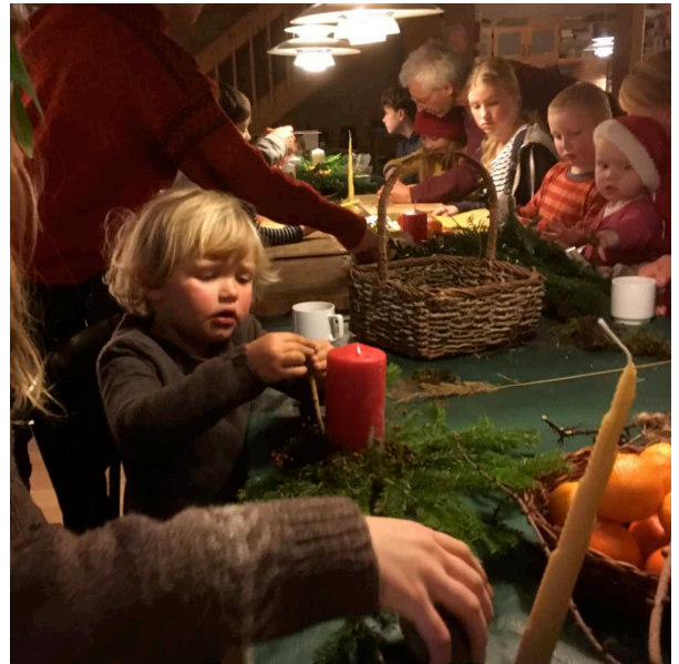
Glimt fra Hjørdis' mobil