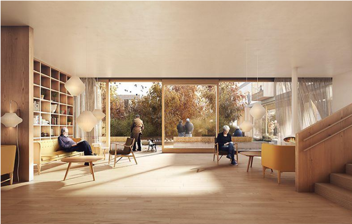
Illustration: © RUBOW arkitekter