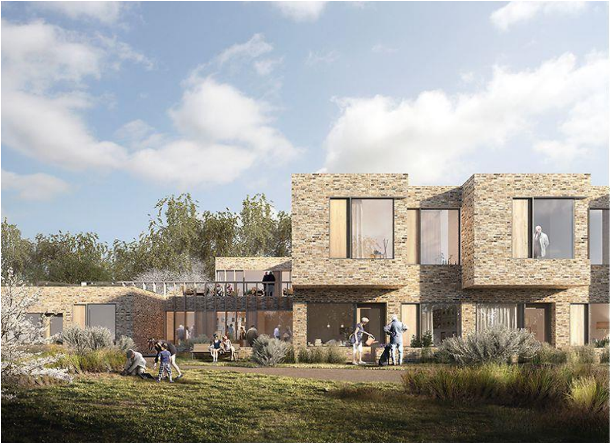
Illustration: © RUBOW arkitekter

Det nye pleje og rehabiliteringscenter er designet efter inspiration fra evidensbaseret forskning om helende arkitektur. Med arkitektoniske elementer som lys, skala, materialitet og rumlige sammenhænge er der i et enkelt hovedgreb skabt en rar og menneskelig atmosfære og med inddragelse af stedets og Hegnets kvaliteter.