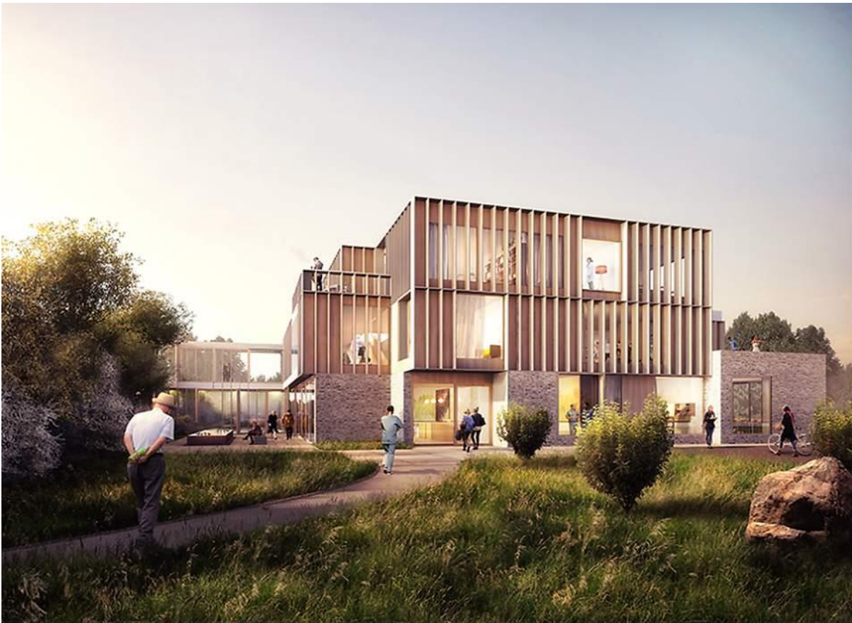
Illustration: © RUBOW arkitekter

RUBOW vinder nyopførelse af pleje- og rehabiliteringscenter i Humlebæk Syd :