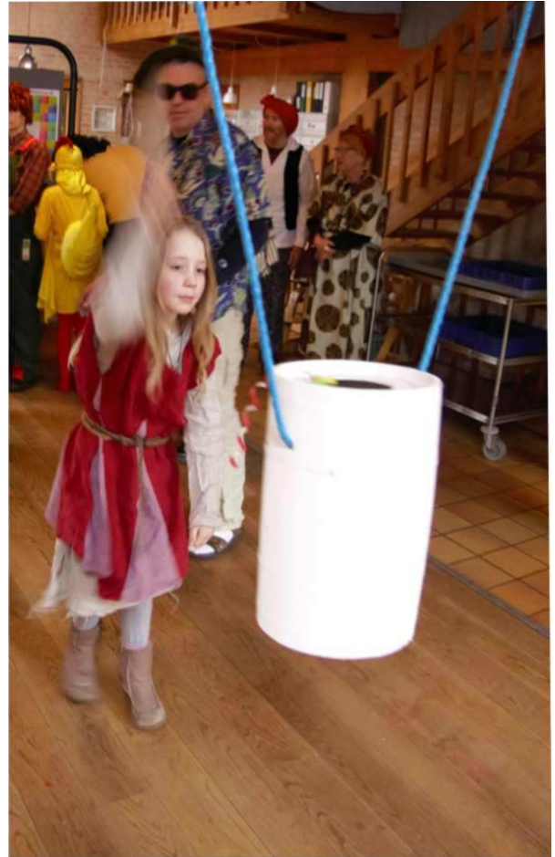
Og så gik både unge og gamle til tønden