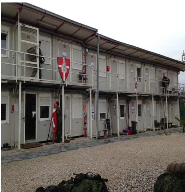
Vores boliger, min er nederst til højre.

I er også altid velkomne til at skrive til mig, på fksimonsen@gmail.com .