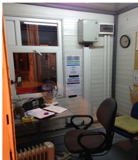
Vagt om natten