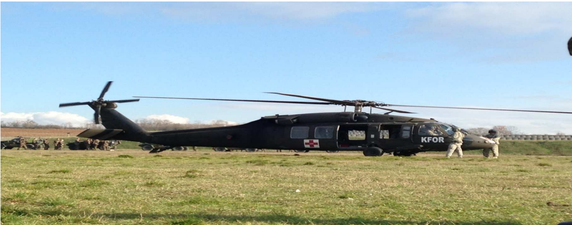
Førstehjælpstræning m. helikopter + Amerikanerne.