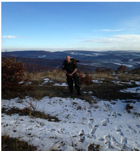
Halvbjerg Dancon March og udsigt