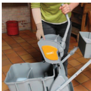
11 - Når gulvet er vasket: Løft pressen af