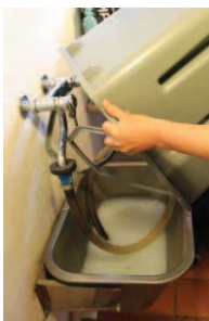
13 - Tøm og skyl spanden, aftør spand og vogn