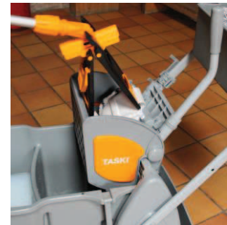
6 - Tryk vandet let af