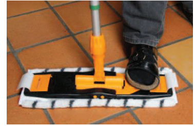
3 - Træd på udløseren ...