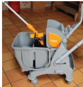
8 - Skyl moppen i rent vand