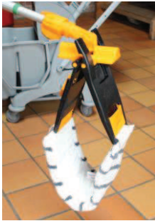
4 - ... og moppen klapper sammen