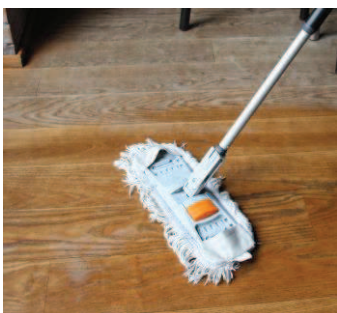
10 - Efter hver omgang vask: Tør efter med tør moppe