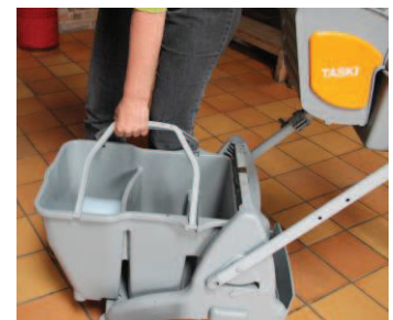
12 - Løft den fyldte spand i håndtagene