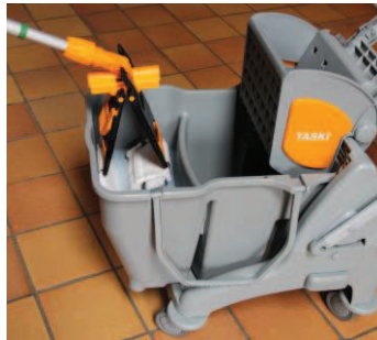
5 - Dyp i sæbevand