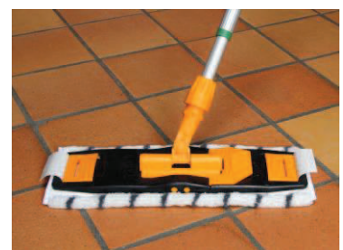
15 - Læg snavsede garner til vask og placér moppeskafter i skabet