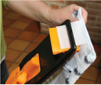
1 - Placér mopgarnets 2 flapper som vist på billedet