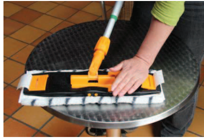
2 - Lås garnet fast