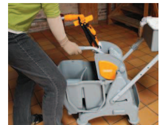
9 - Pres vandet ud af moppen og gentag som vist på billede 5-9