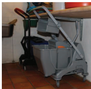
14 - Afmonter pressen, klap håndtaget ind og placér vognen som vist