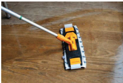
7 - Vask gulvet med moppen