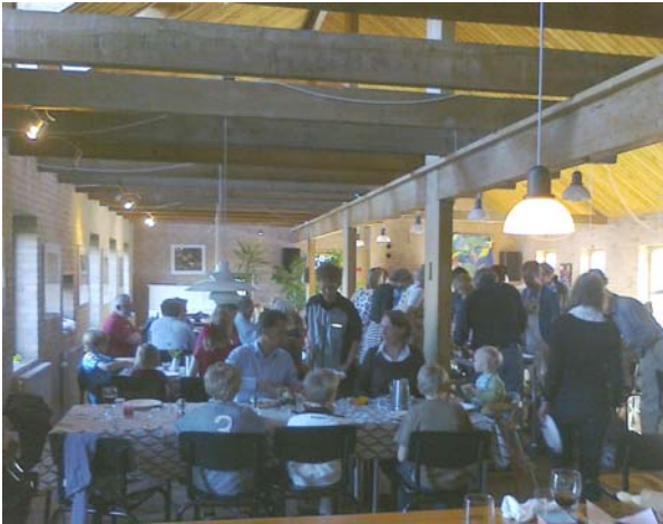
Pizza i fælleshuset