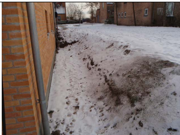
"Gamle" græstotter på skrænten under vintersneen.