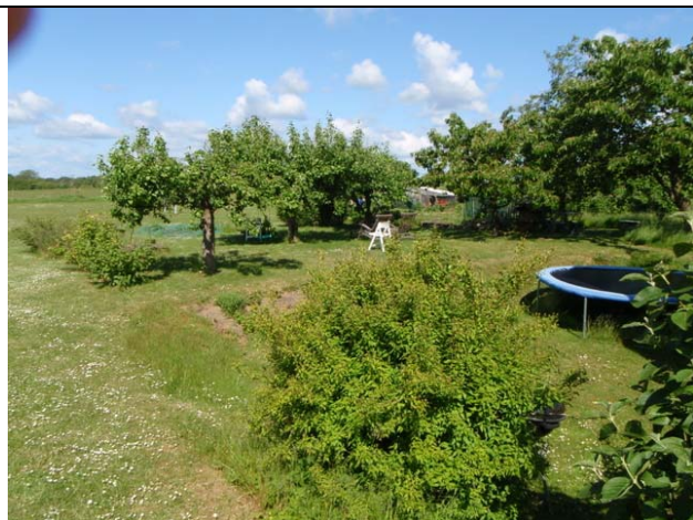
Viser hældning og "afrunding" mod vest

Vedlagt billeder som viser skrænt før og nu.